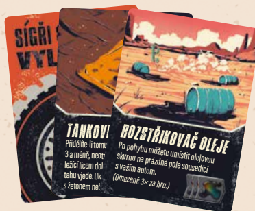
27 karet vylepšení

HRANICE MEZI VÍTĚZSTVÍM A SMRTÍ JE TENOULINKÁ JAK OSTŘÍ BŘITVY.