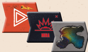
6 žetonů nebezpečí k vylepšení (po 3 žetonech min a olejových skvrn, které použijete s kartami vylepšení Rozstřikovač oleje a Vrháč min).