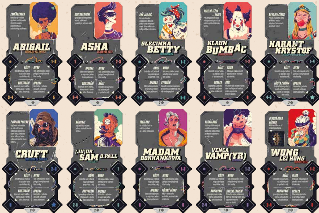
10 příkazových desek velitelů