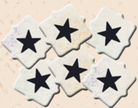
15 žetonů příkazů